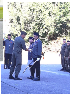
Ehrung des Vorsitzenden v. der LG Niedersachsen für die jahrelange kameradschaftliche Zusammenarbeit