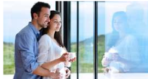
Haus und Wohnung